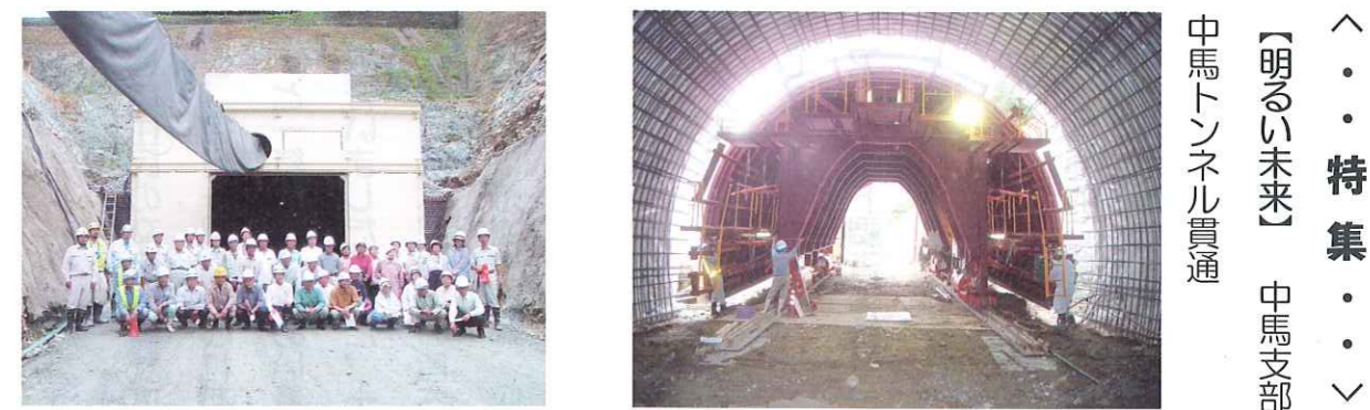
中馬から ← → 中馬河内へ 平成19年2月9日に掘削を開始して7ヶ月半をかけ、去る9月18日トンネルが貫通しました。

新年に思う 「人付き合いの極意」 徳は孤ならず必ず とほろ 鄰あり 訳・内容が充実して謙虚な人柄を 築き上げれば、他人から見ても何ら かの魅力が感じられるようになる のが自然の勢いであるから、此方 から強いて求めなくても何時の間 にか気持ちの通じ合う仲間がひと りふたりと増えてくるであらう。 徳のある人とは思いやりの情が一 寸深いひとりの心です。 (論語入門より) 謙虚な人柄を築き上げれば、気持ちの通じ合う仲間がふえてくる。