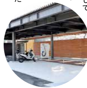
市内の電気自動車の充電スポットが増えました

新型コロナウイルスの影響で一部施設の開業を延期していた道の駅「三矢の里あきたかた」が6月1日(月)、全館オープンしました。県内では20番目、市内では「北の関宿安芸高田」に次ぐ2番目の道の駅です。駐車場は停めやすいノーバックパーキング、パウダールームやキッズトイレを完備した明るく清潔感あふれるトイレなど、施設は利用者の利便性にとことんこだわっています。建物は「産直棟」、「レストラン棟」、「休憩情報発信棟」の3棟で構成され、食や文化など市の魅力を内外に発信。先にオープンしていた「産直棟」の「ベジパーク安芸高田」は「たかた産直市」の売り場面積を約2倍にして商品ラインナップを充実。野菜に加え、鮮魚や精肉、特産品や地元の方が手掛けた