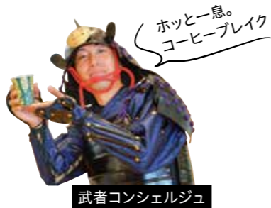
武者コンシェルジュ

LEDライト付 キーホルダー 500円 たかたんをつまむと点灯。しっかり明るく照らします