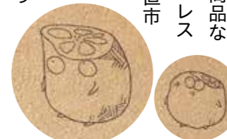
駅内に散りばめられた野菜キャラクターを探そう!(全6種類)

ハンドメイド商品なども並びます。レストランでは産直野菜を使用した産の野菜をたっぷり使用。また、オープン前から話題を集めていた高級食パンは、販売開始から連日完売し、なかなか手に入ることができない商品になっています。観光客の周遊拠点として、市民の憩いの場として進化し続けるこれからの道の駅に注目です!