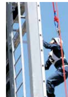
救助隊員訓練披露

消防車の乗車体験やレスキュー体験など、消防士の仕事内容や防火防災について、子どもから大人まで楽しみながら学べる消防ふれあいイベントを開催します。参加費無料でどなたでも参加できますので、ぜひお立ち寄りください。(詳しくはチラシ、ホームページをご覧ください)