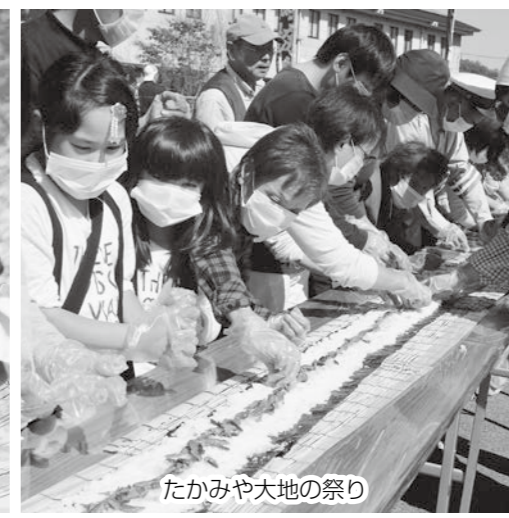
たかみや大地の祭り