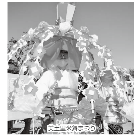
美土里米舞まつり