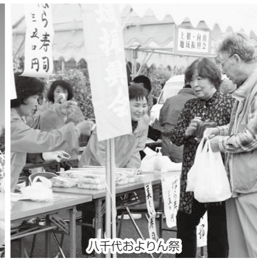
八千代およりん祭