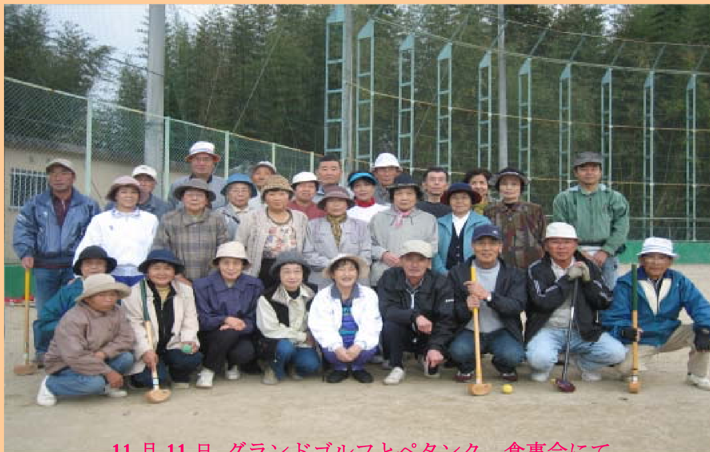
11月11日 グランドゴルフとペタンク、食事会にて