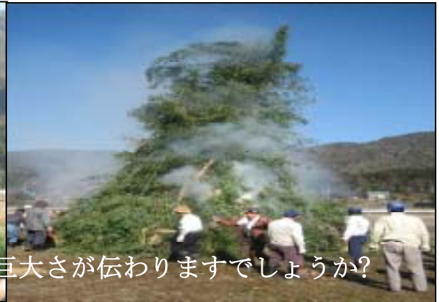
昨年のとんどの様子です。巨大さが伝わりますでしょうか？