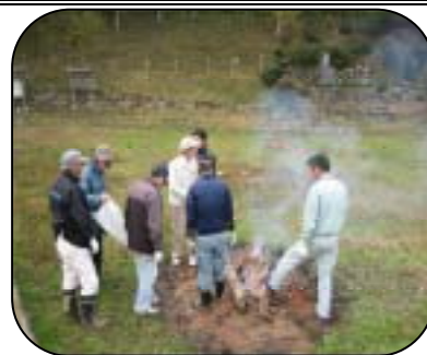
【登山前のミーティング】

11月25日（日）に10名がかたくりハウスに集まり、これまで地域探検隊のシリーズで紹介しておりました田屋城跡への登山を行いました。