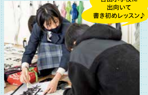
吉田小学校に出向いて書き初めレッスン♪