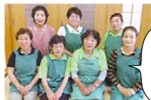
安芸高田市食生活改善推進協議会 美土里支部