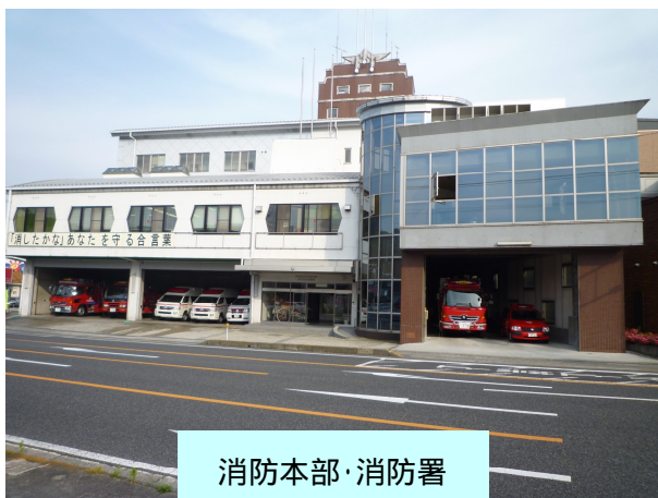
消防本部・消防署