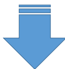
平成33年度 児童数推計（統合後7校となった場合）