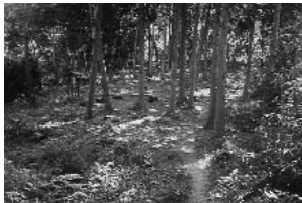
▲ 多治比猿掛城跡・本丸跡