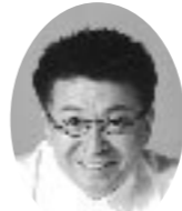
講師 生島ヒロシ(キャスター)

入場申込●入場は無料ですが、入場整理券が必要です。入場希望者は、はがき、ファックス、申込書(安芸高田市各支所に配置)、お電話のいずれかの方法で郵便番号、住所、名前、電話番号、入希