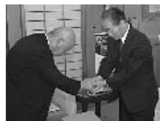
▲引継ぎが終わると、織田市長職務執行者からは「よろしく」と、児玉市長からは「お疲れ様」とガッチリと手を握りました。