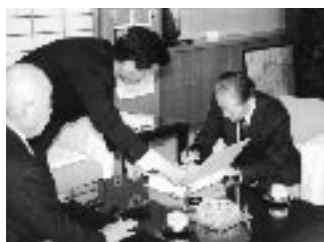
▲3月1日からの事務の状況を、織田市長職務執行者から引継ぎを受けました。