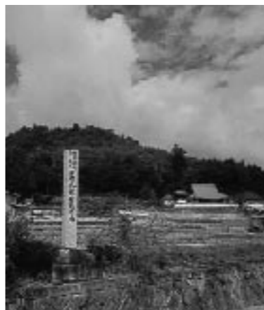
◀ 有田中井出合戦跡地