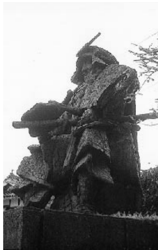
▲ 毛利元就像 (この像は吉田町地域振興事業団事務所の敷地の中にあります。)