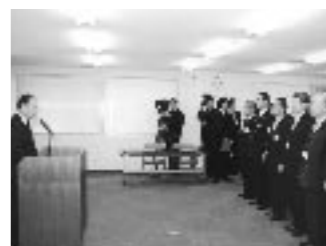
▲職員を前に「新しい市を自分たちでつくり上げていくんだという気概をもって仕事に取り組んでいただきたい。」と、訓示をおこないました。