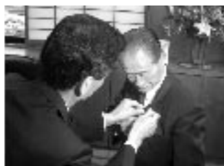
▲市長室で最初に行われたのは、市長のバッジの取り付けでした。上着の左側のえりにつけられました。