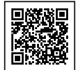
違反対象物公表制度