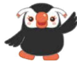
北方領土 イメージキャラクター 「エリカちゃん」

2月7日は「北方領土の日」 1855年2月7日に、日魯通好条約が調印され、北方四島が日本の領土として国際的に明確になりました。その歴史的な意義等から2月7日が「北方領土の日」とされています。この機会に北方領土問題について理解を深めましょう。 令和4年度北方領土に関する標語最優秀賞(独立行政法人北方領土問題対策協会) 『四島選せ! 声出し合って 動く今』