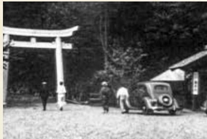
右の建物は郷土史調査会直営の案内所兼土産販売店「春霞荘」。現在は駐車場。