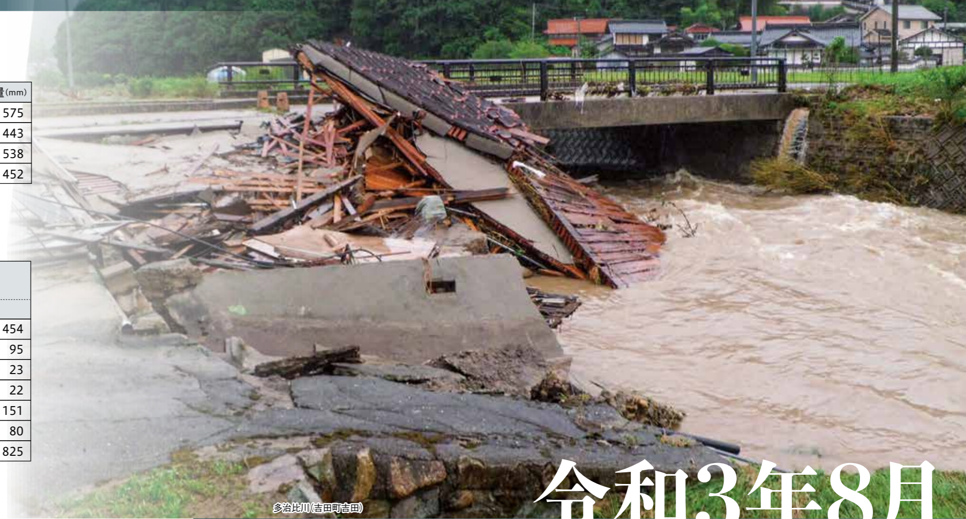
多治比川(吉田町吉田)