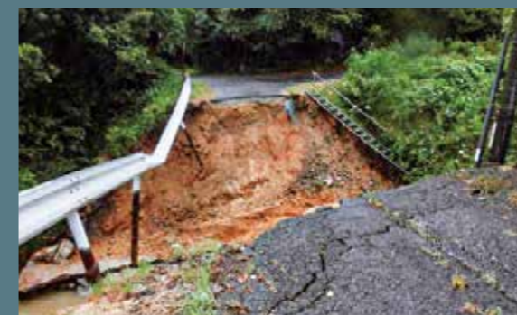
雨乞橋線(高宮町原田)