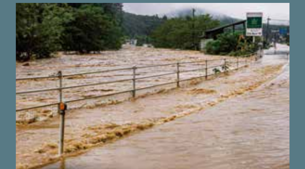
県道甲田作木線(甲田町浅塚)