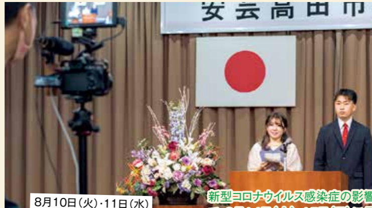
8月10日(火)・11日(水) クリスタルアーヂョ