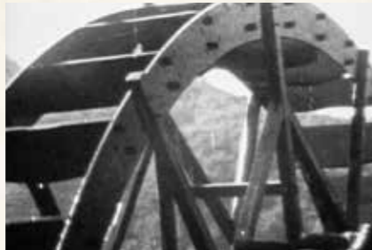
町の北東、柳原地区の江の川に設置されていました。当時の吉田の見どころの一つだったようです。