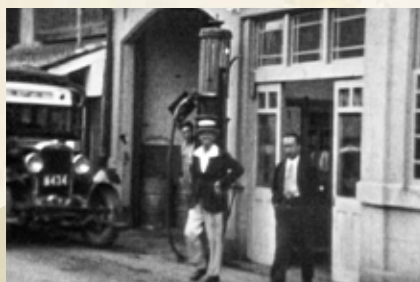
吉田町に本社をおいたバス会社。昭和初期はバス路線が次々開拓されました。