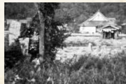
江戸時代、苦しむ民衆の救済事業として、へらとザルを使い造られたという庭園跡。市役所の東南辺り。