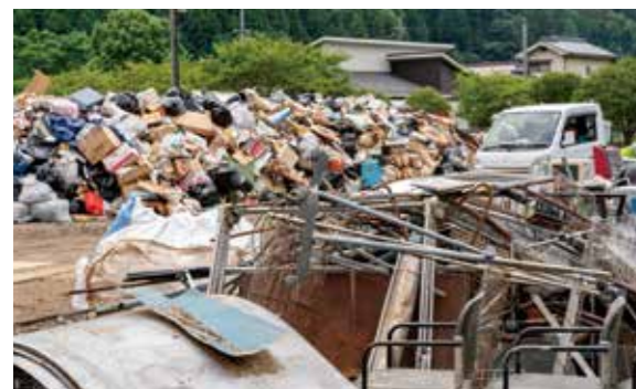
災害ゴミ(吉田大浜運動公園)