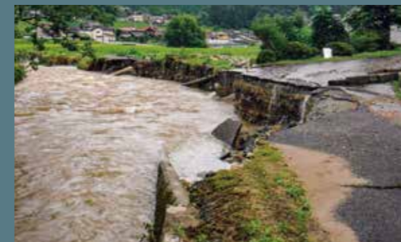
市道中原線(美土里町本郷)

8月11日(水)から降り続いた前線の停滞に伴う大雨は、観測史上最多の雨量を記録。安芸高田市は、河川の氾濫や土石流などで、甚大な被害を受けました。