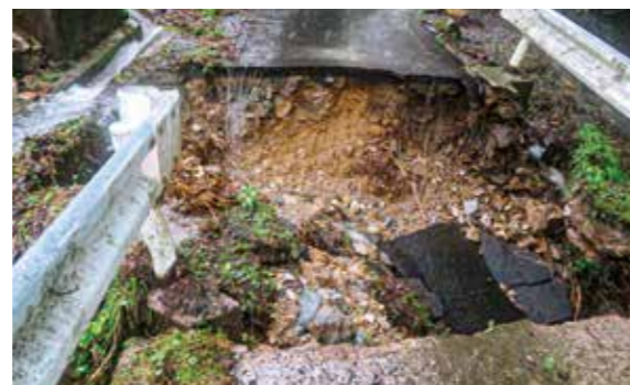
市道下土師線(八千代町土師)