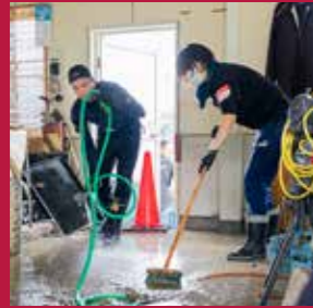
〈今月の表紙〉 豪雨災害の被災地で復旧活動をしている 災害ボランティアの皆さん