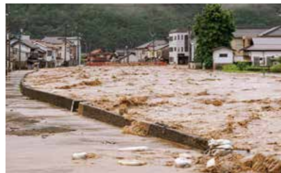
多治比川(吉田町吉田)