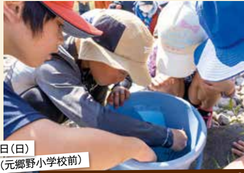
8月1日(日) 江の川(元郷野小学校前)