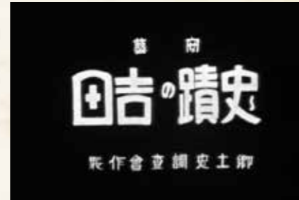
フィルムは町内外に貸し出されました。