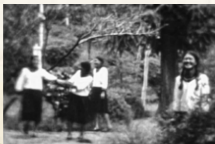
大正4(1915)年造園。恥づかしそうに登場する麓の女学校生徒。