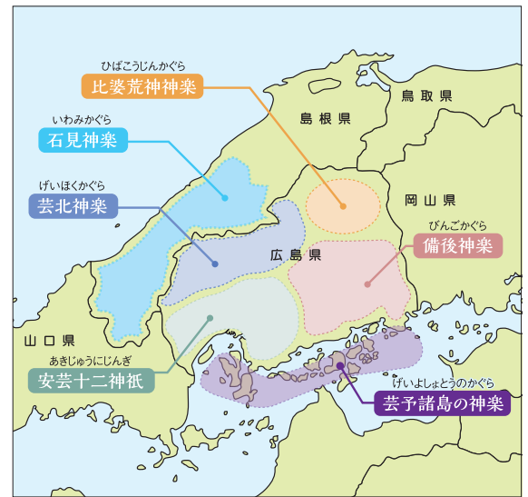
※参考文献：三村 泰臣「広島県の神楽探訪」南々社

広島県と島根県西部の石見地域には、あわせて約440の神楽団および神楽社中があるとされていますが、それぞれの舞いやお囃子の特徴を比べながら鑑賞していただくことで、神楽の奥深さや魅力を感じていただけるのではないかと思います。