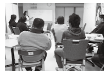
参加者の方の活動や思いを伝える場にもなる「移住者交流会」。第3回目には、市内でマクロビオティック料理教室をされている方にお話をいただきました。

存在する状態。その点を繋げていけば、大きな力となるのではないかな、今開催している交流会が、そのきっかけの場となればいいな、と期待しています。また、ゆくゆくは安芸高田市に移住を考えている方の最初の交流の場になればいいなと思います。 交流会以外でも個人的な繋がりができた人や、それぞれの仕事を繋げてそこにビジネスを考える人。回を重ねるごとに、そこには新しい交流が生まれ、「やっつてよかったな」という思いを毎回感じています。今後も継続していくつもりですので、興味のある市内のU・Iターナーの方はぜひ参加してみてくださいね。 連絡先・政策企画課 ☎42-5627 寄能隊員まで