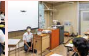
ドローンプログラミング実演