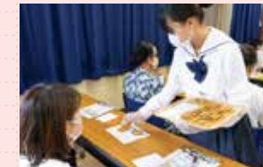
米粉クッキーの試食

1回目の8月2日(水)は地域貢献活動をメインで紹介。地域住民と生徒が共に取り組んでいる米粉、ドローン、ガーデニング、それぞれのプロジェクトについて資料を作って説明しました。それらの活動を体験できるプログラムも設け、和気あいあいとした雰囲気でも盛り上がりました。