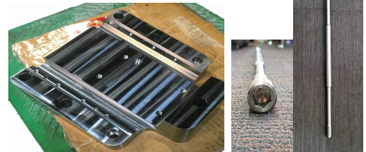
■マシニング2D加工 材質:SS400