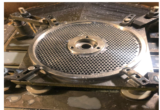
■旋盤加工+マシニング加工 材質:SKD11