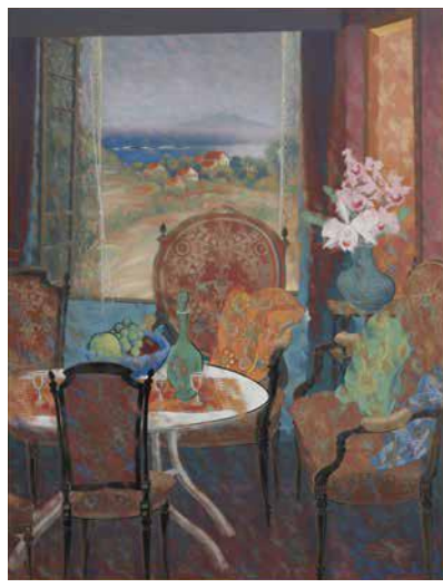
児玉希望《室内》1952年 絹本彩色 広島県立美術館