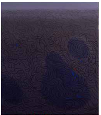
児玉希望 《瀾》 1964年 絹本彩色 広島県立美術館