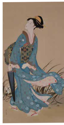
児玉希望《雨晴》1940年 絹本彩色 二階堂美術館