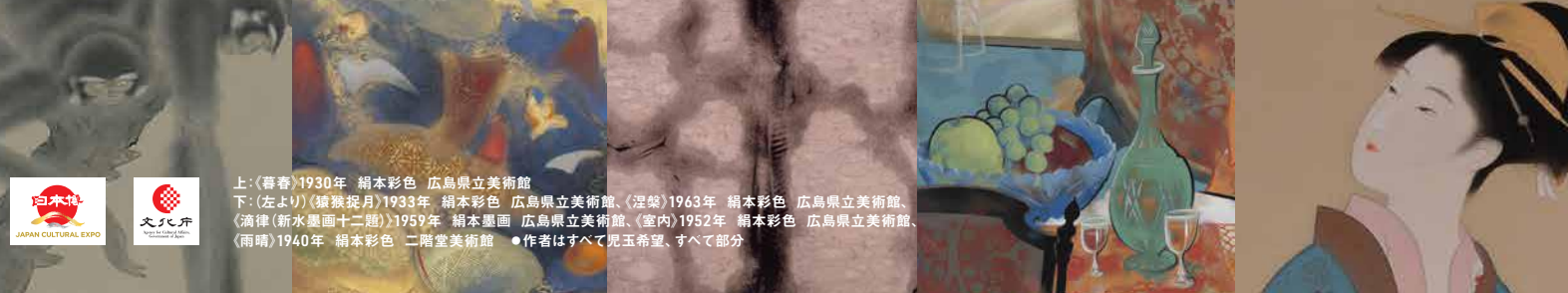
上:《暮春》1930年 絹本彩色 広島県立美術館 下: (左より)《猿猴捉月》1933年 絹本彩色 広島県立美術館、《淫笑》1963年 絹本彩色 広島県立美術館、 《滴律(新水墨画十二題)》1959年 絹本墨画 広島県立美術館、《室内》1952年 絹本彩色 広島県立美術館、 《雨晴》1940年 絹本彩色 二階堂美術館 ●作者はすべて見玉希望、すべて部分

広島県立美術館 Hiroshima Prefectural Art Museum