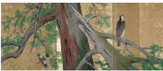
児玉希望《槍鷹図》1942年 絹本彩色金泥引 華鶴大塚美術館