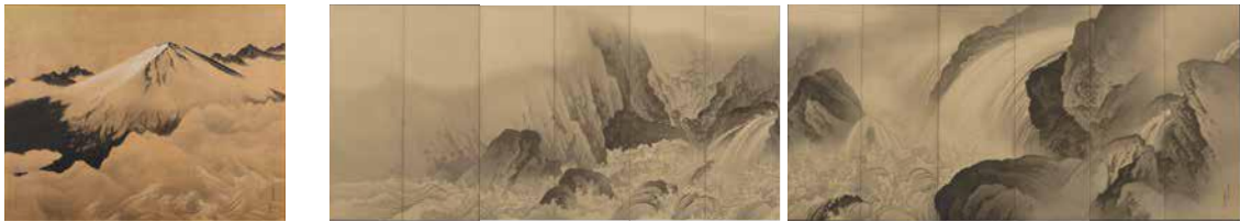
左：横山大観《正気放光》1942年 紙本墨画 海上自衛隊第1術科学校教育参考館 / 右：川合玉堂《奔潭》1929年 絹本墨画 大倉集古館