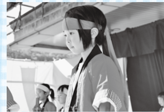
向原きてみん祭土曜夜市で、発表を終えてほっと一息つく女の子(7月25日撮影(土))

(メールで送られる場合は、件名に「おやこクッキング教室申し込み」と入力して、本文にお子さんの名前、年齢、アレルギーの有無、きょうだい参加有無(有の方は、名前、年齢)を入力してください。)