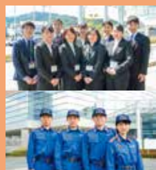
〈今月の表紙〉 令和2年度 安芸高田市新規採用職員