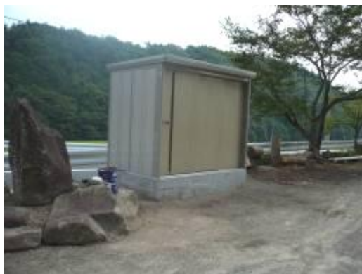
広場に設置された大きな防災倉庫

「大規模災害に備えて」と題した安芸高田市防災講演会に参加し、事前の準備と訓練・災害時の対応の重要性を感じました。他の支部に少しでも近づける様努力していこうと思います。