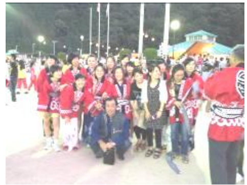
タマシゲデンソーの社長さんを囲んで法被姿の中国人女性の皆さん達が勢ぞろい

参加当初は、少し遠慮がちな様子から、プログラムが進むに連れて、自ら積極的に参加の意思を示され、大変楽しんでいただき、良い思い出にもなられたようです。