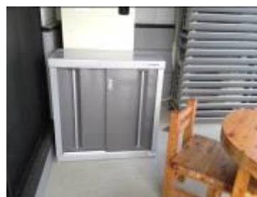
可愛振興センター正面横のテラス角へ、左のポリタンクが入ったBOXが設置してあります。