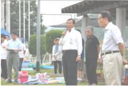
市長を迎えて、恒例の第19回の大会を開催しました。200名以上の大参加者により熱戦が繰り広げられました、