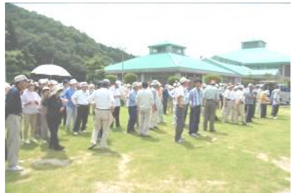
戦い終えて、結果報告を待つ参加者のみなさん