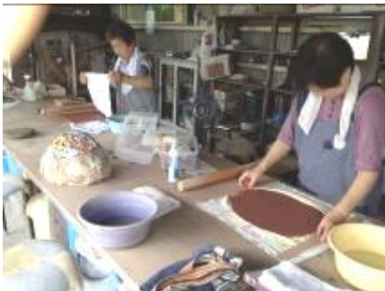
当日は、四名の会員さんと、粘土作業をされていました。粘土の空気を抜くのがポイントとのこと。熟練作業の一つ。

ここには、作品を窯で仕上げる「炉」(石油窯)が完備し、昔は、吉田町唯一の窯であった。ここから生み出される陶器の作品は、すでに県美展などで入賞された経験者の方の作品や普段の生活上の日常使用品など様々で、今はもっぱら可愛文化祭・郷野文化祭に出品されている。