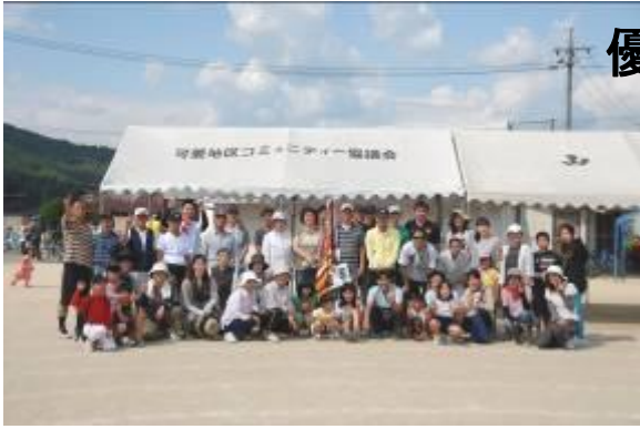
全員で勝ち取った薄氷の勝利！