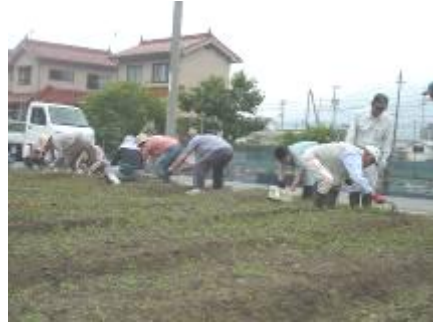
当日は、朝早くから支部ごとに花の苗をBOXに移植する作業を実施。