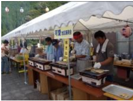
バザー担当では、焼き鳥の販売に汗を流しました。すべて完売となりました。