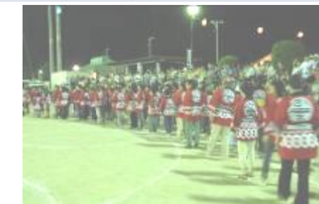
総勢120名以上の一心節踊りの参加があり、可愛地区の心意気を示しました