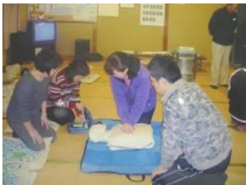
はじめての操作に、興味津々

(自主防災活動) 安芸高田市消防署のご指導を頂き、昨年十一月に本谷地区住民を対象に実施した自主防災訓練の一つである簡易担架の作成、AEDの操作実習を、宮之城地区においても三月二十三日に三十二名の参加のもと実施しました。