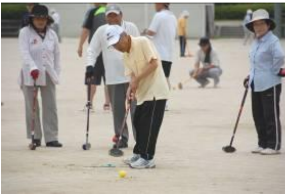
ホールインワンもたくさん達成されました