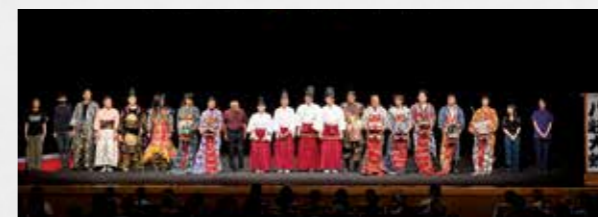
迫力のある舞に、会場からは多くの拍手が送られました。

その継承のされ方と公演のテーマが重なったこと、市がこれまで取り組んできた都市部での公演で認知度が高まっていることから安芸高田市の神楽団が招待されました。