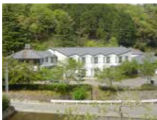
建設時の総工費は約3億5千万円

※1 2020～2022年度の当初予算平均。 ※2 公共施設の運営を代行する事業者に対して市が支払うお金。 ※3 黒字化が見込めないため、入浴設備の大規模改修も見送っています。