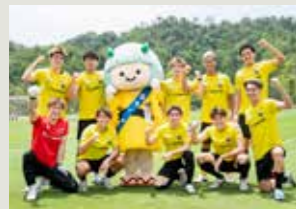
(今月の表紙) Jリーグで活躍する サンフレッチェ広島ユース出身選手

本庁・支所連絡先 安芸高田市 ☎お太助フォン 42-2111 (代) 八千代支所 ☎お太助フォン 52-2111 美土里支所 ☎お太助フォン 54-0311 高宮支所 ☎お太助フォン 57-0311 甲田支所 ☎お太助フォン 45-4111 向原支所 ☎お太助フォン 46-3111