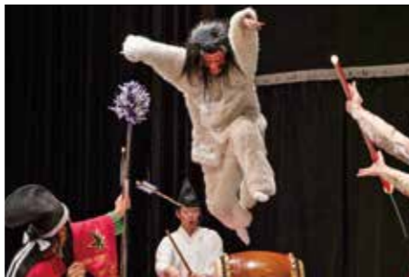
高猿神楽団「源頼政」