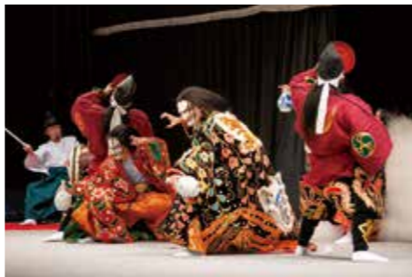
八千代神楽団「紅葉狩」