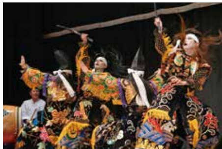
吉田神楽団「厳島合戦」

「吉田神楽団」「高猿神楽団」「八千代神楽団」が3年ぶりに開催された共演大会で迫力の舞を披露。新作の演目もあり、市内外から集まった多くの神楽ファンからは惜しみない拍手が送られました。