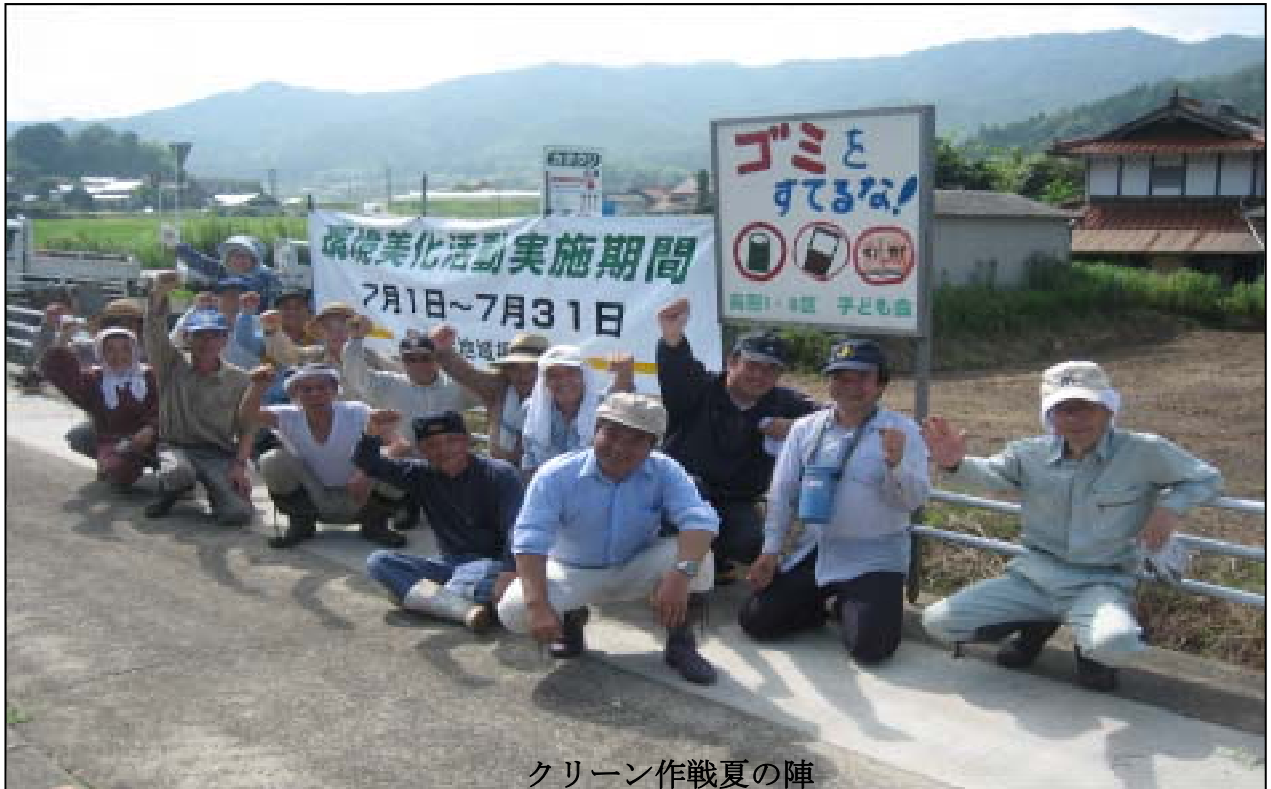
クリーン作戦夏の陣