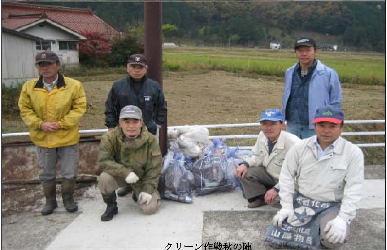
クリーン作戦秋の陣