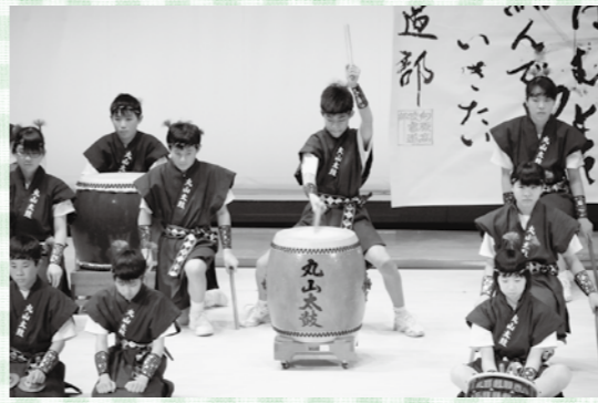
第29回青少年の声を聴く会で、丸山太鼓を披露する向原中学校の生徒たち(1月25日(日)撮影)