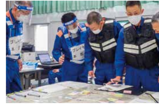
大規模な土砂崩れを想定して、岡山市消防局指揮支援隊と本部運営訓練を実施しました。