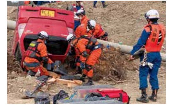
土石流で埋まった家屋や車両を想定して、県内応援隊・緊急消防援助隊山口県隊が埋没者救出訓練を実施しました。