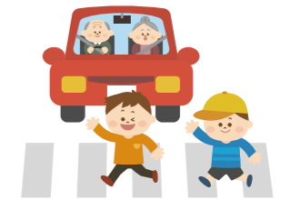
「信号機のない横断歩道での歩行者横断時における車の一時停止状況全国調査」(JAF調べ)