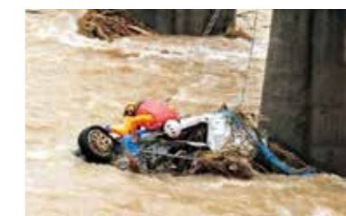
河川に転落した車両内の検索