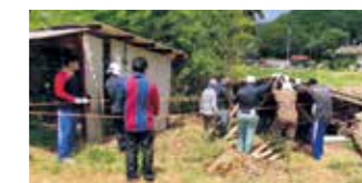
作業するワクナガレオリックの選手