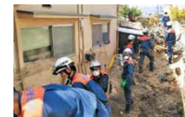
坂町小屋浦地区での捜索・救助活動