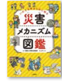
エディット/著 京都大学 防災研究所/協力 二見書房/刊

防災を考えると、災害の仕組みを知ること大切。どんな仕組みで起きるのか、どんな場所で起こりやすいのかなどを分かりやすく学べます。