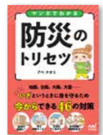
アペナオミ/著 マイナビ出版/刊

災害発生時に身を守るため、家具の配置の工夫やマストな備蓄品など、今からできる対策を東日本大震災を経験した著者がマンガで分かりやすく紹介。