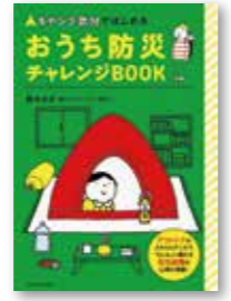
鈴木 みき/著 エクスナレッジ/刊

アウトドアの知識やグッズが災害時の避難生活に役立つ!「おうち防災チャレンジ」を通じて、楽しみながら在宅避難について考えてみませんか。