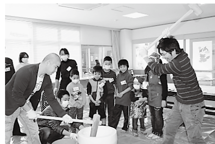
ファミリーサポートセンターの交流会での一コマ