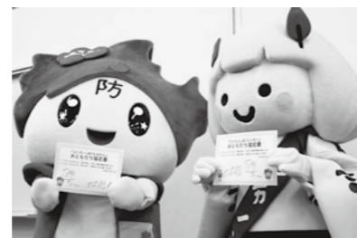
お互いのサインが書かれた「おともだち協定書」を持つたかたん & ぶっちー

もだち協定の前には、両市長によるマスコットキャラクターの交流に関する覚書の調印を行いました。今後、更なる安芸高田市・防府市民の交流を図って参ります。