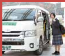
〈今月の表紙〉 「お太助ワゴンを利用する高校生」