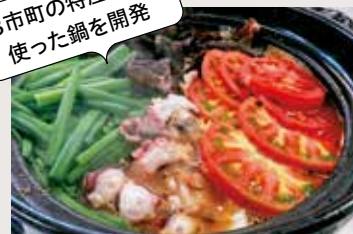
三矢の訓ちゃんこ鍋