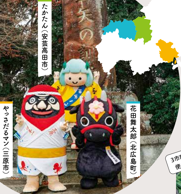
たかたん(安芸高田市)