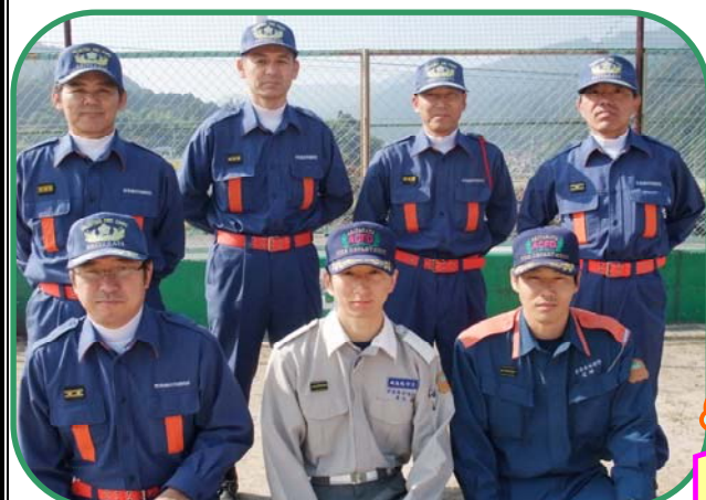
講師に来ていただいた消防署と消防団（第3分団の幹部）の皆さんです。

これから空気が乾燥する季節になりますので、火の元には、くれぐれも注意してください!!