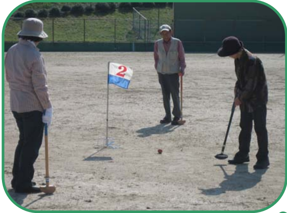
グランドゴルフ（個人）入賞者 向かって右から1位、2位、3位