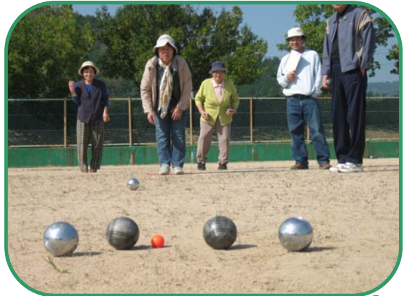
ペタンク入賞チーム 上から1位、2位、3位