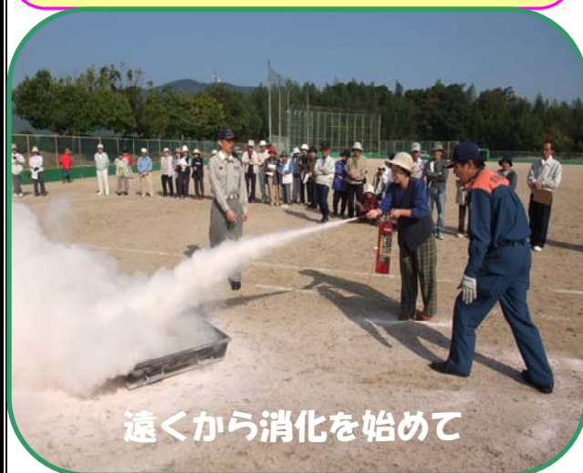
遠くから消化を始めて

住宅火災の原因では、コンロ火災（天ぷら火災）が最も多く、タバコの不始末、放火、ストーブ火災の順となっています。