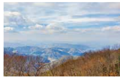
安芸高田一の高さがこちら。

なれば登山じゃない」という方には、こちらが断然お勧めです。ただ、それ以外の方は間違えて選ばないでください…引き返すのも大変ですから!!