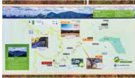
随所に案内があるので安心です。

保垣ルートは、東広島向原線から山の方へ入って車で15分の場所が登山口です。標高600mの辺りから頂上まで、約2kmの道のりとなっています。尾根を通る部分が多く、気分的にも体力的にも(割と)楽なコースです。一方、坂ルートは、集落の近くに登山口があります。標高300mの辺りから、ひたすら谷を登る約3kmの道のりで、ストック(登山用の杖)があっても厳しいほどの勾配が続きます。「苦しくなければ登山じゃない」という方には、こちらが断然お勧めです。ただ、それ以外の方は間違えて選ばないでください…引き返すのも大変ですから!!