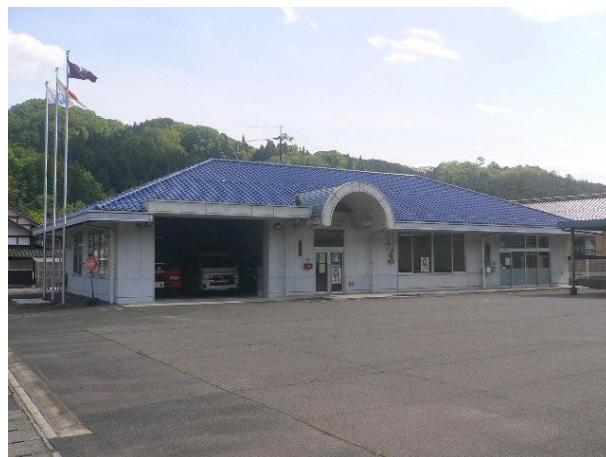
安芸高田消防署 北部分駐所