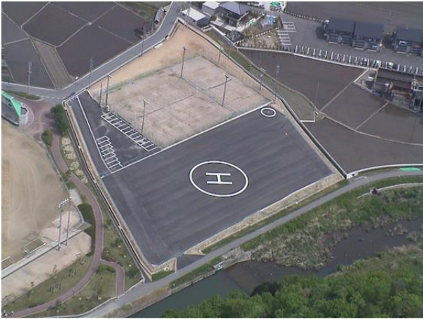
安芸高田消防ヘリポート