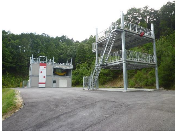
安芸高田市消防本部訓練場 (西浦訓練場)