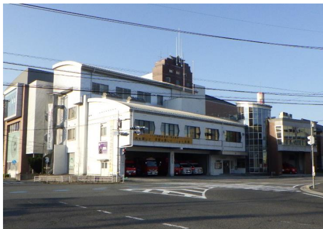
安芸高田市消防本部 安芸高田消防署 本署