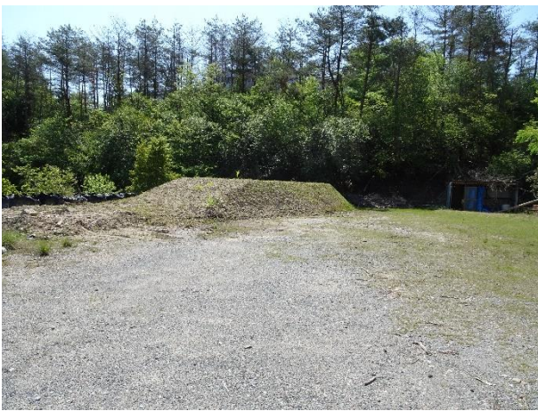
安芸高田市消防本部訓練場 (土砂災害対応訓練場)