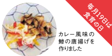
カレー風味の 鱈の唐揚げを 作りました

安芸高田市食生活改善推進協議会甲田支部は、現在約40人の会員で活動しています。今年度初めて、子育て中のお母さんを対象に、料理教室を行いました。子どもの頃に食べた味は年齢を重ねても舌に残る味です。特に、減塩やバランスのとれた食事は大切です。ぜひ、日々の食事でお子様の成長を見守ってほしいと思います。