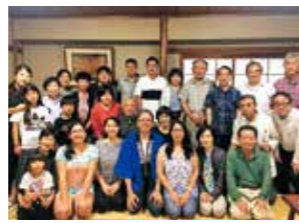
歓迎会で記念撮影。急ぎよ20名を超えるみなさんが集まりました。

台風7号の影響でカーブ観戦も中止。しゃあないのー。また今度、郡山に登ったり、カーブの試合を観たりすればいいのでしょうかね。宿題にしとこーかいのー。