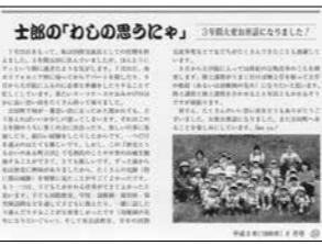
22年前に連載していた紙面