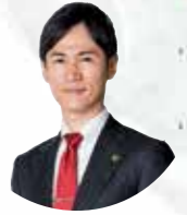
安芸高田市長 石丸 伸二