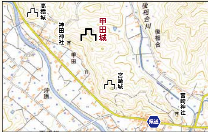
位置図(国土地理院標準地図より)