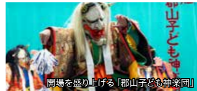
開場を盛り上げる「郡山子ども神楽団」

“人を大切にふれあいと交流の輪をを広げよう”をテーマに「お菓子釣り」や「ビンゴゲーム」「子ども神楽」など小さなお子さんも楽しめる楽しくておいしい文化祭を開催します。