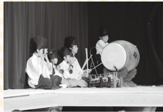
第16回美土里こども神楽発表大会での一コマ(9月15日(月・祝)撮影)