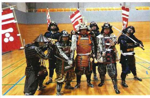
雷雨のため出番のなかった勇ましい「元就」隊(吉田地区)のメンバー

最後に、祭りを盛り上げていただいたステージ発表の皆さん、そして実行委員の皆さんお疲れ様でした。有難うございました。