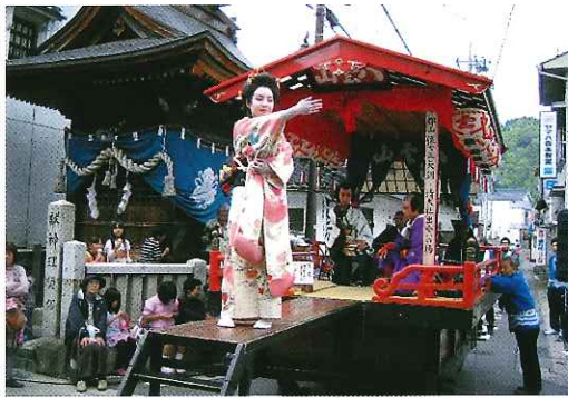
八雲山「郡山懐古三矢訓 清大社出会の場」

今年も主役を務めたのは吉田中学2年生8名が「子ども歌舞伎」を千歳山・八雲山のだんじり屋台上で演じたもので、演技が決まる都度、沿道から惜しめない拍手が送られていた。