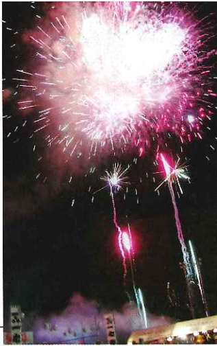
迫力ある2,300発の連射花火

今年も例年通り沢山の見物客をお迎えし、夏の想い出の1ページとなりました。是非とも来年の一心祭りもご期待ください。