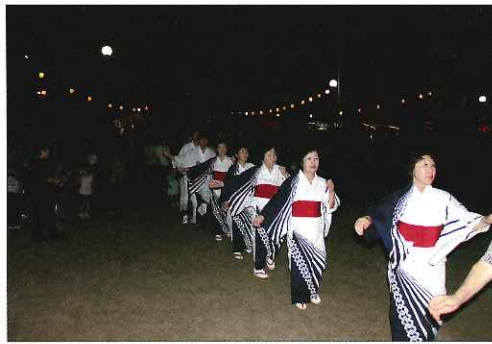
4地区振興会・企業・団体・中学生などが輪になって踊った一心節踊り

今年も例年通り沢山の見物客をお迎えし、夏の想い出の1ページとなりました。是非とも来年の一心祭りもご期待ください。