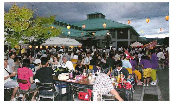
毎年大盛況の飲み食い広場 今年も沢山お買上げを頂きました

最後に、祭りを盛り上げていただいたステージ発表の皆さん、そして実行委員の皆さんお疲れ様でした。有難うございました。