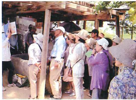
ガイドの説明に興味しんしんの参加者

6月1日(日) 88名の参加により、大型バス2台に分乗、ふるりの歴史と関わりをもつ吉備路とその周辺の史跡探訪に出発する。ハシの国・岡山にふさわしく快晴に恵まれた山陽自動車道を快走、ガイドは予備知識を蓄えた文化教育部会員の皆さん。