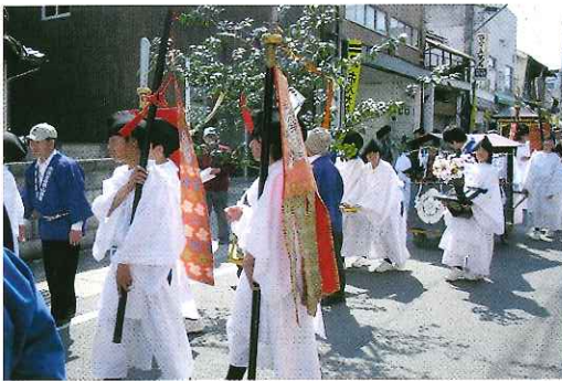
神輿の行列 (中学1年生)

また神輿の行列では、この4月に入学したばかりのまだあどけない中学1年生の男女33名で編成され、町内各所のお旅所をはしやぎながら巡り歩いていた。