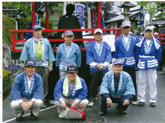
祭りの応援に出られた振興会の方々

さらに子ども向けの「ストラックアウト」や「ゆらゆらコイン落とし」では、命中するたびに甲高い声が続くまで聞かされた。