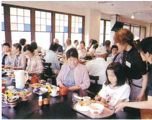
研修の後は楽しい昼食