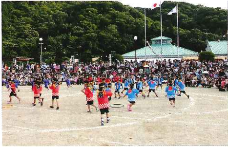
小学生児童も元気に頑張ってくれました

7月19日(土)午後5時から、恒例の一心祭りが吉田運動公園で準備万端のもっと盛大にスタートしました。しかしながら、午後8時前から激しい夕立に襲われ大勢の見物客が建物の軒下やテントの中に駆け込み、しばしの間、時計が止まった状態になりました。 結局は、花火の打ち揚げを約1時間繰上げ、武者行列が取止めとなりました。毎年、夕立に悩まされる