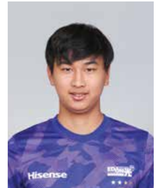
背番号35/MF/174cm/69kg 2006年4月22日生まれ

新しいサッカースタジアムの開業が目前に迫りました。サンフレッチェ広島のさらなる活躍に期待が膨らむばかりです。新シーズンを迎えるに際して、ユース出身の新加入選手をご紹介します。