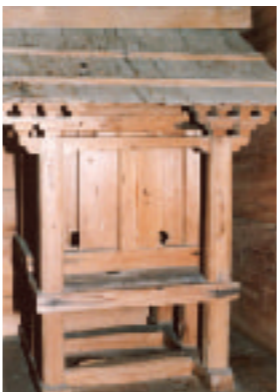
写真3 常盤神社玉殿・第三殿

編集後記 バスや電車、新幹線や飛行機。自家用車での移動が多い私は、公共の乗り物に乗ると、少しだけ旅行に行くような気分になります。車中には、日ごろ読みたいと思っていた雑誌や本を持ち込みます。読みきれないとは分かりつつ、ついでに準備してしまいます。▼学生時代は、高速バスに乗って広島市内まで通学していました。寝過ごしして三次まで数回行ったことも、今では良い思い出です。もう10年前のことですが、高速バスに乗ると、今でもそのころのことを懐かしく思い出します。▼合併して、利用回数が増えたものに、JR芸備線があります。それまでは駐車場の利用の仕方が分からなかったため、あまり乗りませんでした。知るとものすごく便利で、生活の幅が広がった気がしています。▼JR可部線が廃線になったのは、まだ記憶に新しいことです。しかし、安芸高田市内の公共交通にもすぐ近くに迫った問題なのかもしれません。みんなで乗ることが公共の乗り物を守ります。昨年から美土里町の道の駅に高速バスが乗り入れになりました。今度は道の駅に車を止めて、広島や大阪へ行ってみようと考えています。