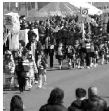
昨年の出初式の様子

一年の災害に対する消防関係者の誓いをしめすとともに、市民の皆さんに消防の装備や訓練を披露することで、防火・防災の意識と、消防機関に対する信頼感を高めてもらうことを目的に、2回目となる安芸高田市消防出初式を開催します。 ■とき 3月5日(日) 午前10時～ ■ところ 安芸高田消防ヘリポート(吉田運動公園となり)