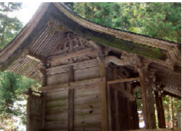
写真1 常盤神社本殿

ており、元の八幡神社における八幡三神に相応するとみられます。3基の玉殿は、流見世棚造といわれる様式のもので、実際の神社本殿を小型化した造りとなっています。また建立当初の薄長板葺の屋根が残るなど、保存状態も極めて良く、中世後期の神社社殿を知る貴重な資料として、平成3年に県重要文化財に