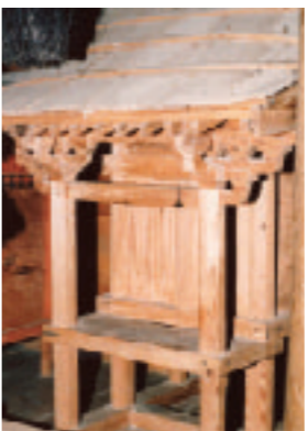
写真2 常盤神社玉殿・第一殿 室町時代後期 高さ1.08m

指定されました。なお同社の合併前の前身である八幡神社は天文年間の中頃(1532—154年頃)毛利氏の重臣・桂元澄が再建、祈願所としたと伝え、一方の新宮神社は天文10年(1541年)毛利元就の二男・吉川元春が再建、祈願所としたと伝えられています。参考文献 『広島県文化財調査報告第18集』(平成4年) 『広島県文化財ニュース』第167号(平成12年) 『高田郡誌』(大正2年)