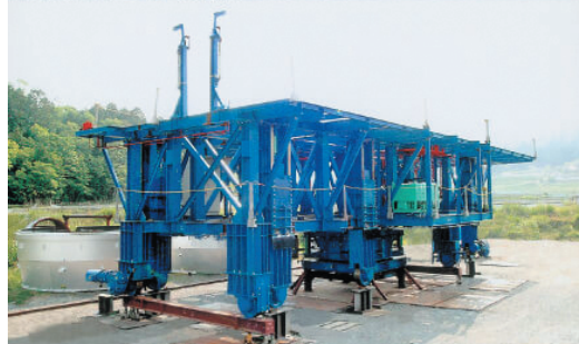
■高炉用大型溶射装置