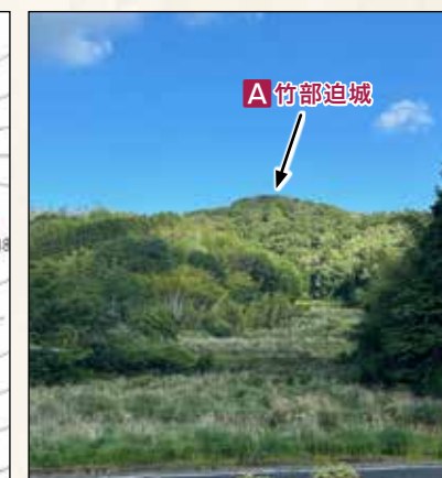
竹部迫城遠望(野部側国道より撮影)