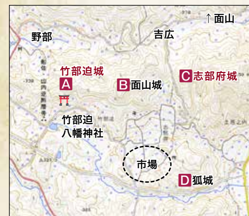
周辺城跡位置図(地理院地図に加筆)