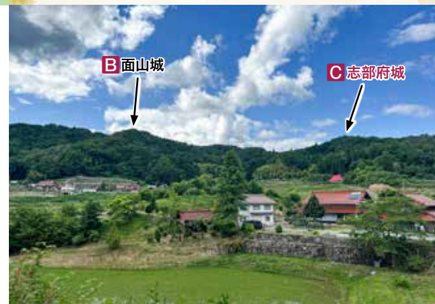
面山城～志部府城遠望(南側「市場」より撮影)