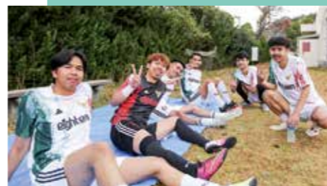
参加者 計41人 (その他 観客など50人以上)