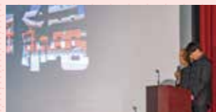
各学年から代表者が登壇し、学習成果を発表しました。