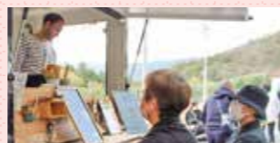
PTAによる食品バザー、一般の方によるキッチンカーも登場。

10月28日(土)、「Let's Have Fun〜少人数でも心を一つに盛り上げよう〜」をテーマに文化祭を開催しました。今回は秋の恒例行事「菊花祭」と合体させての開催で、1年生は菊づくりの成果発表、2年生は修学旅行先の沖縄の歴史や地域についての事前学習の発表、3年生はチュロス、ハッシュドポテト、アイスの販売をしました。また、地域連携講座に参加している生徒は、米粉、ドローン、ガーデニング、それぞれの活動成果をプレゼンテーション。一般公開は4年ぶりで、100人近い保護者や卒業生、地域の方に来校していただき、盛り上がりました。