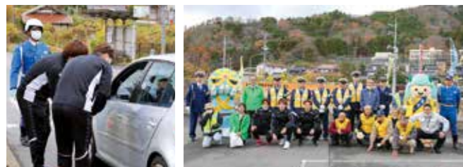
▲安全運転を呼び掛けるワクナガレオリックの選手

市からは警察署や交通安全運動推進隊、交通安全協会、向原町老人クラブ連合会が参加し、安佐北警察署や広島県トラック協会、ワクナガレオリックも連携してドライバーへ安全運転を呼び掛けました。