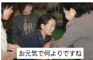
お元気で何よりですね