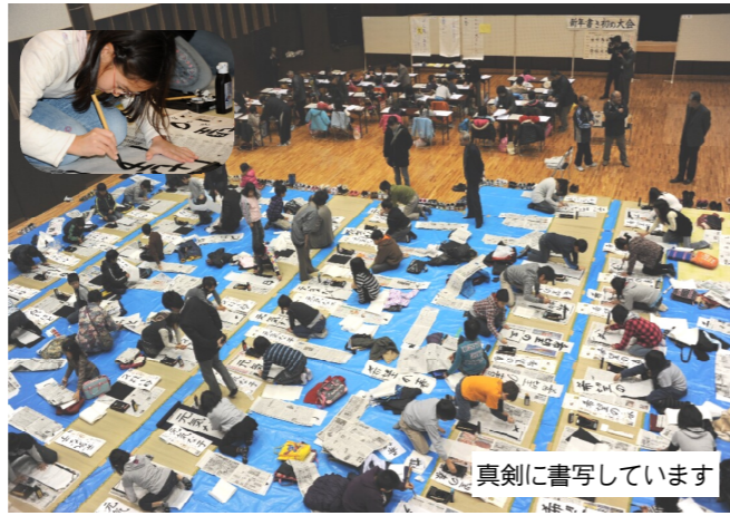
真剣に書写しています