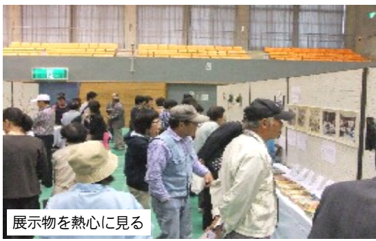
展示物を熱心に見る