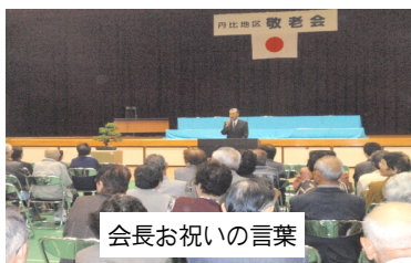
会長お祝いの言葉

本年度も、皆さんからお預かりした会費を最大限有効活用すべく活動を推進しますので、今後ともご支援・事業参加、よろしくお願ひします。