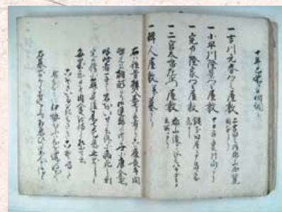
写真2 国郡志御用二付下調査出帳(部分) 個人蔵 同書では「古跡之部」の項目の中に「韓人屋敷併墓アリ」として記されている。