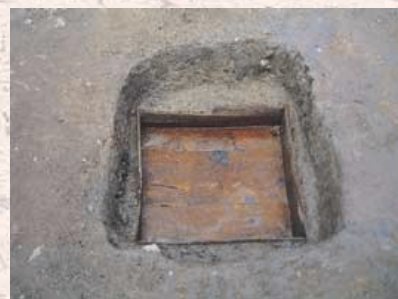
写真3 郡山城下町遺跡の木棺墓 一辺約63cmの木棺底部が高さ15~25cmが残存していた。比較的小型の棺である。

参考文献 ・復刻芸藩通志第2巻(昭和38年) ・『高田郡史』上巻・資料編(昭和47年・56年) ・『郡山城下町遺跡』発掘調査報告書(平成5年)