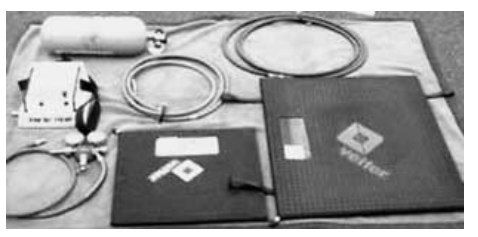
空気ポンプ調整器 ゴムマット(右:大、左:小) 接続ホース3本