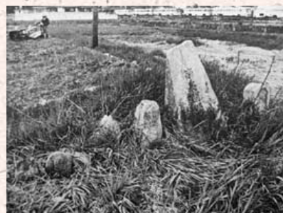
写真1 韓人墓(移動前)