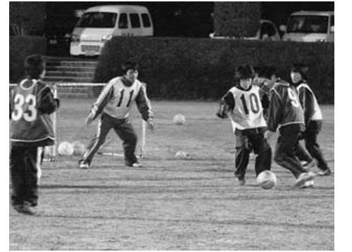
ユース時代、考えるサッカーの大切さも学んだ。自分は何をすべきかの判断も伝えたいことの一つ。

コーチを引き受けた。 「この安芸高田市の子どもたちはとても恵まれていると思います。」