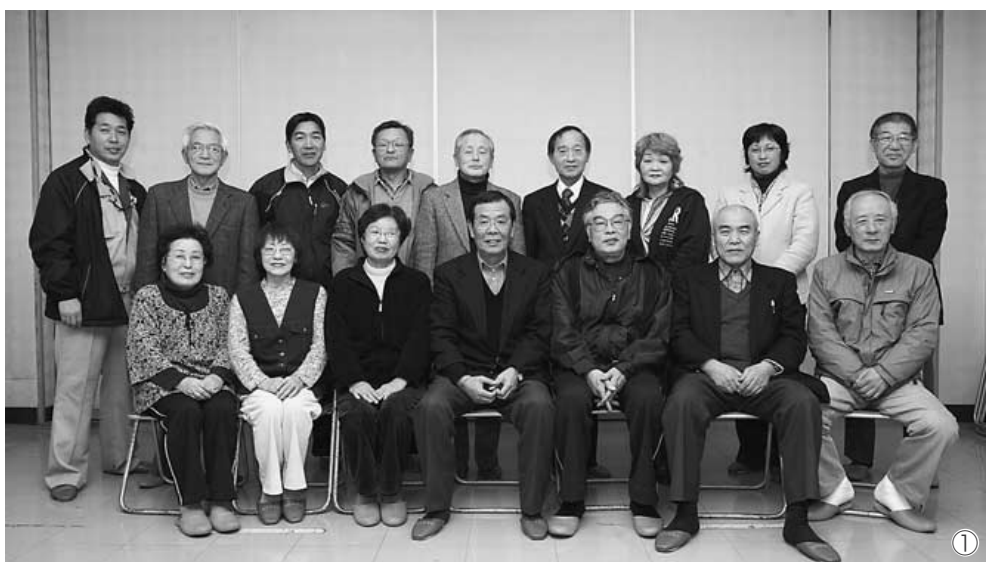
①可愛地区振興会の役員の方々の皆さん。 ②可愛地区文化祭は、舞台発表と地域の人たちの自慢の作品が展示される。 ③支部対抗で競う可愛地区町民運動会。 ④児童の下校の際の見守り。子どもたちもよくあいさつをする。

「守っているから」と勧められたそうなんです。それがきっかけとなって、この地域に來られたと聞きました。他の地域の方にも、可愛は安全な地域として認められているんだ、自分たちの取り組みで、安全が作れているんだと、改めて感じました。」