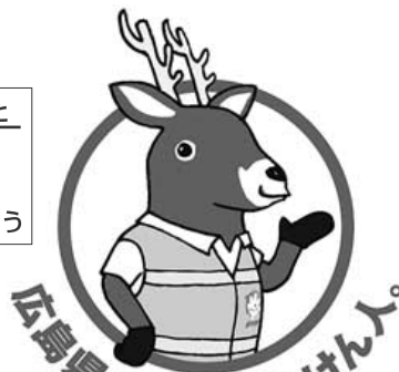
「減らそう犯罪」広島県民総ぐるみ運動 マスコットキャラクター「モンカ」

いってください、「ATMコーナーに着いたらこのフリーダイヤルに電話をかけてください」などの言葉が出たら、それは詐欺です。 もしこのような指示をされたら、それに従うことなく、安芸高田警察署(TEL47-01110)や市役所総務課(TEL42-1143)に電話をして相談し、被害にあわないようにしましょう。