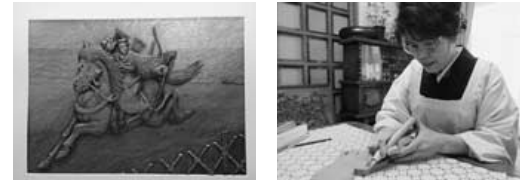
馬に乗った人が矢を放つ様子が彫られているレリーフ。着物の柄まで細かく作られている。刃の大きさが異なる15本の彫刻刀を使い作品を作られている。