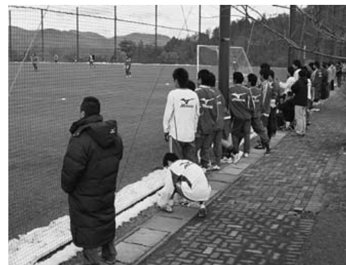
サポーターと一緒に練習を見学するユースたち。先輩たちも、こうしてプレーを見てきたはず。