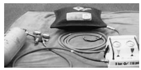
ゴムマット(小)を膨らませたところ

重量物排除器具はゴムマットに空気を入れて膨らませることにより、事故車両などの重量物の下敷きになった人を救助する場合に使用する空気ジャッキです。膨らませる前は薄いため(厚さ2.5cm)、機械のジャッキが入らない隙間でも使用できます。また、動力にエンジンを使っていないため火気が使えない場所でも使用可能です。