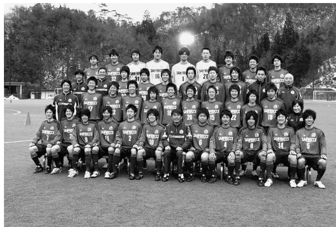
新年度のユースチームのメンバーは36人。チーム一丸となって日本一を目指す。

高校時代に築いた絆は、 選手たちにとっても大切なもの。 とても心強く思っているはずです。