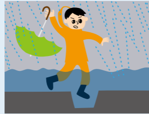
浸水した際に、道路との境界が分かりにくい水路や側溝